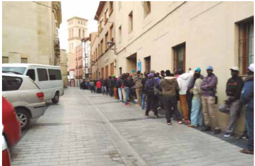
Los temporeros hacen fila para entrar en la Cocina Económica de Logroño

Como en anteriores años, el recurso principal que corre a cargo del Ayuntamiento para los temporeros es el Centro Municipal de Acogida, que realiza la acogida de todos los que la demandan, proporcionándoles alojamiento, vales de manutención y atención social, consigna para depósito de sus enseres, aseos portátiles y la coordinación con otros recursos.