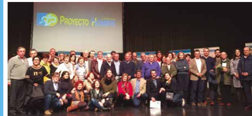
El 29 de noviembre, en el auditorio del Ayuntamiento de Logroño, Proyecto Hombre La Rioja celebró una fiesta para conmemorar su 25 aniversario.

Todos los colectivos, desde los países hasta los equipos de fútbol, cuando hablan de sus inicios tienden a escribir una historia legendaria en la que abundan los héroes y las situaciones insalvables superadas gracias a la valentía colectiva. Además, no suele faltar un enemigo lo suficientemente aterrador para unir y dar un sentido y una visión común. En Proyecto Hombre La Rioja podríamos relatar nuestra historia así pero con una diferencia, que no hay nada de leyenda ni de mito, que nuestra narración, sin necesidad de acrecentarla, está plagada de héroes y heroínas, situaciones épicas y un enemigo terrible al que derrotar en mil y un batallas libradas a lo largo de estos 25 años.